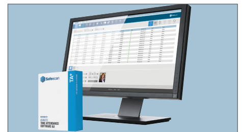
KOMPATIBEL MIT WINDOWS XP, VISTA, 7, 8 UND SERVER 2003/2008