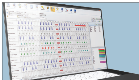
PLANUNG UND BUCHUNGSZEITEN IN EINER RASTERANSICHT